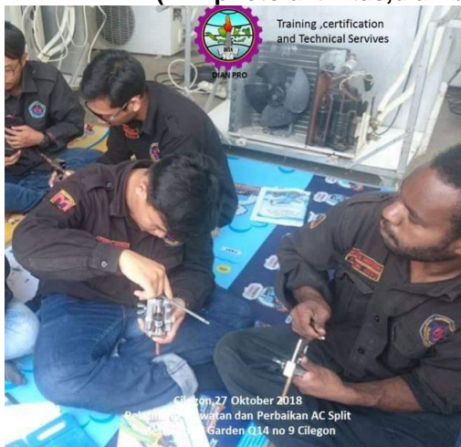
Praktek flaring dan swaging

(NB :photo aktivitas,diambil sebelum ada wabah covid)