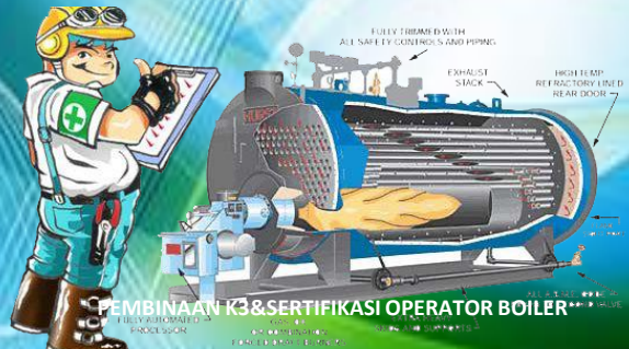
PEMBINAAN K3 & SERTIFIKASI OPERATOR BOILER