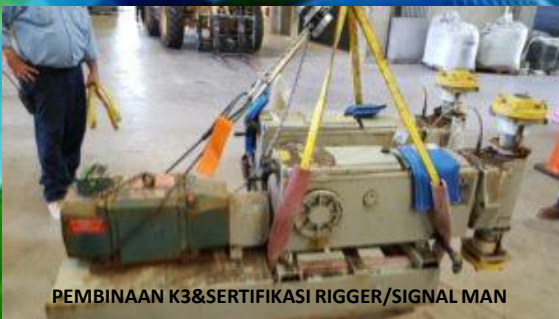
PEMBINAAN K3 & SERTIFIKASI RIGGER/SIGNAL MAN