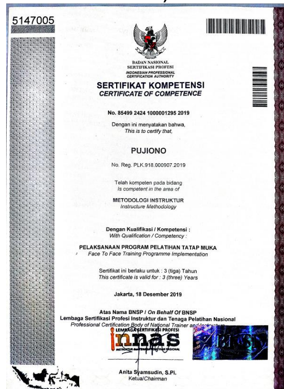
Contoh Sertifikat BNSP