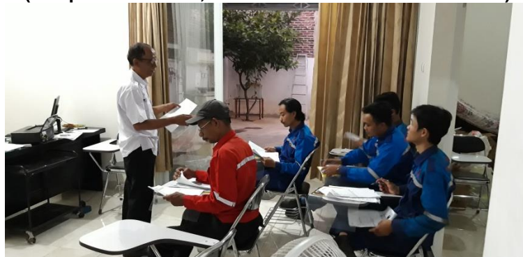
Pengisian Form dari BNSP (NB :photo aktivitas,diambil sebelum ada wabah covid)