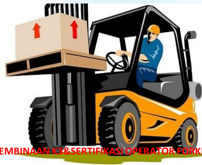
PEMBINAAN K3 & SERTIFIKASI OPERATOR FORKLIFT