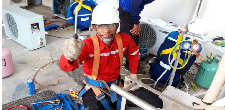
Peserta Uji kompetensi Perawatan dan Perbaikan AC Split (NB :photo aktivitas,diambil sebelum ada wabah covid)