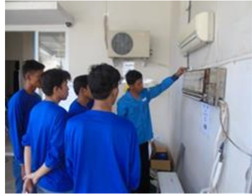
Pengenalan Komponen dan fungsi pada Indoor AC

(NB :photo aktivitas,diambil sebelum ada wabah covid)