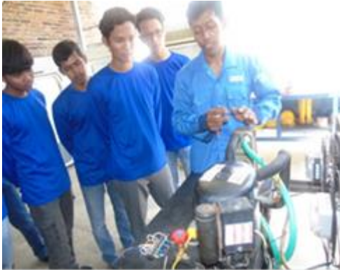
Simulasi Siklus Refrigerasi