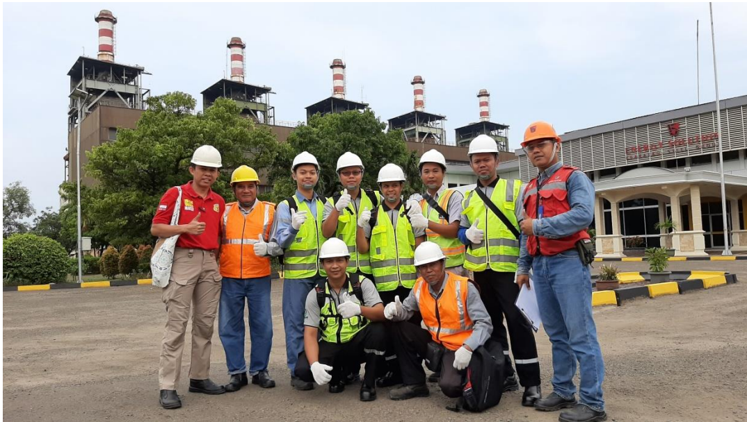
Observasi Lapangan (photo diambil sebelum ada wabah covid)

(NB : photo Aktivitas diambil sebelum ada wabah covid)