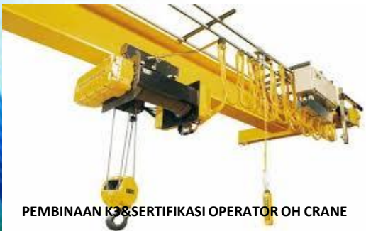
PEMBINAAN K3 & SERTIFIKASI OPERATOR OH CRANE