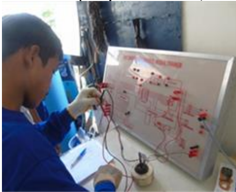
Praktek trouble shooting

(NB :photo aktivitas,diambil sebelum ada wabah covid)